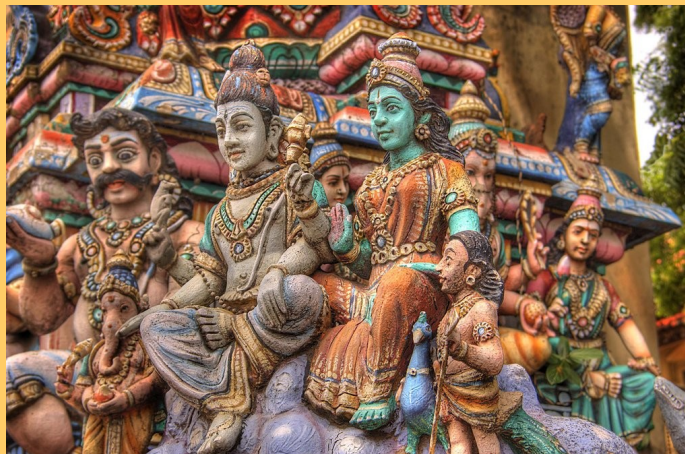
Chennai – particolare del tempio

Partenza dall’Italia con volo di linea per l’India. Pasti a bordo. Arrivo in aeroporto a Chennai in serata, incontro con il nostro rappresentante locale, assistenza e trasferimento in hotel. Trattamento di pensione prescelto. Pernottamento.