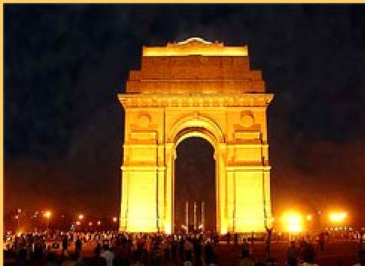
India Gate - Delhi